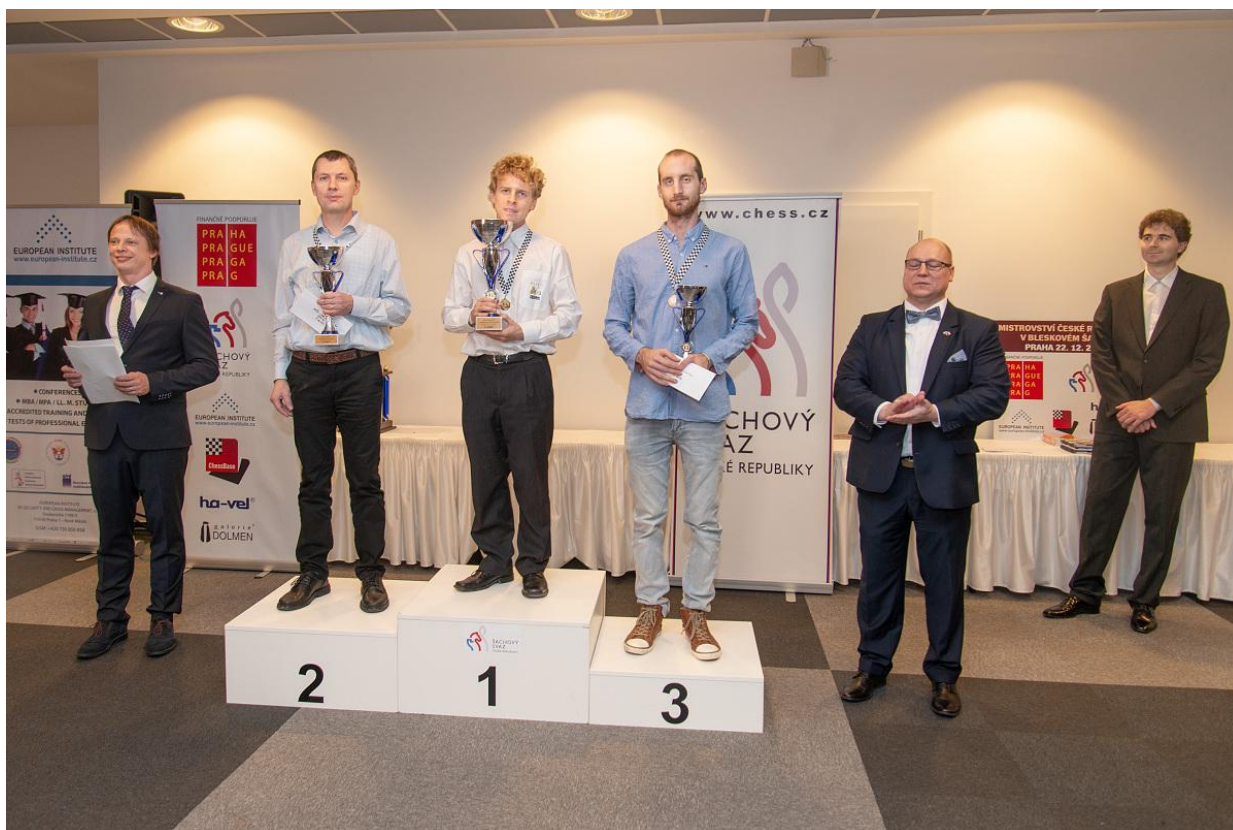
Vyhlášení MČR mužů v bleskovém šachu 2018

Po skončení mistrovství proběhlo předání výročních cen ŠSČR. Šachistou roku 2018 se stal Jiří Štoček a Šachistkou roku se stala Olga Sikorová. Podrobný článek o MČR v bleskovém šachu i o výročních cenách ŠSČR najdete na webu ŠSČR . Tématem MČR v bleskovém šachu se zabýval i speciální díl pořadu V šachu .