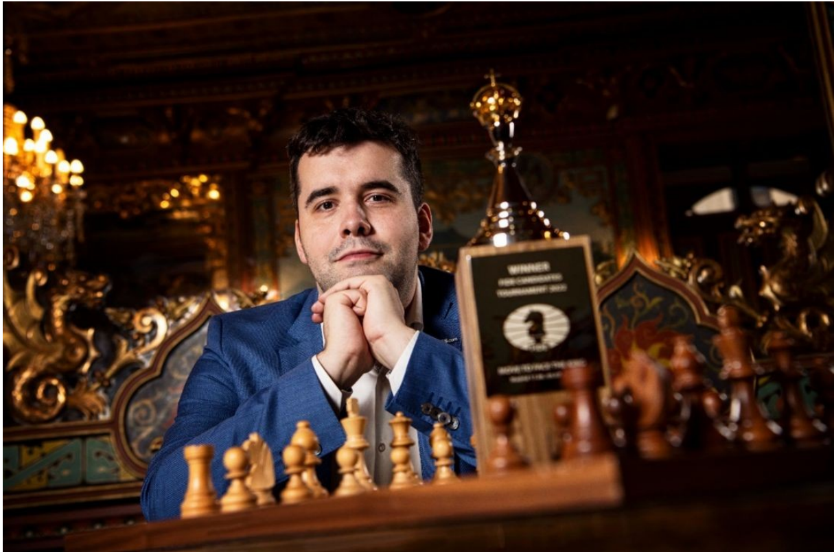
Vítěz Turnaje kandidátů pro rok 2022, Jan Nepomňaščíj