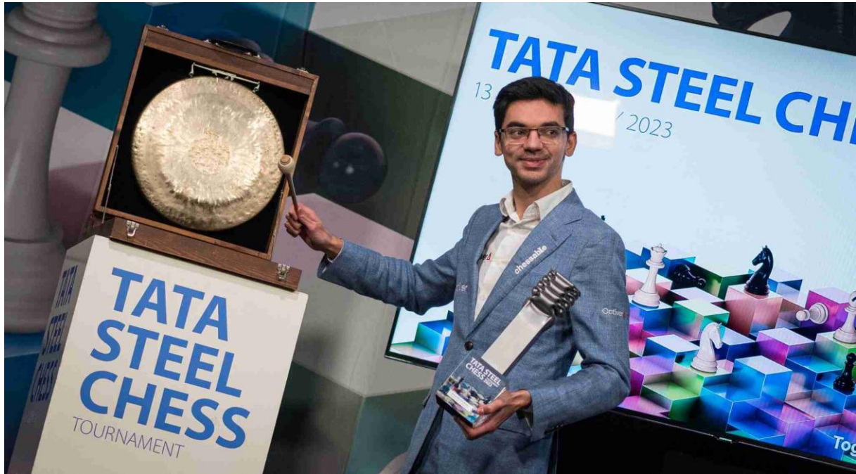
Vítěz skupiny Masters 2023, Anish Giri